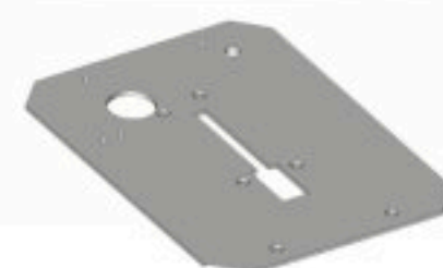
Table de travail en Inox